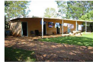
Wohnbaracke im Camp

OM Südafrika betreibt in der Nähe der Hauptstadt Pretoria das Emmanuel Training Centre. Das FSJ-Programm gilt als Missionstraining und soll Menschen auf ein Leben in der Mission vorbereiten. Nach jetzigem Informationsstand sieht meine Arbeit während des Einsatzes etwa folgendermaßen aus: Im ersten Halbjahr (September bis Januar) werde ich an einigen Stellen praktisch helfen; dazu gehören Schulen, Waisenhäuser, Pflegeheime (vorwiegend AIDS-Pflege), Kinderprogramme, Gemeinden und Straßenevangelisationen. Das wird die Teamarbeit und den Umgang miteinander fördern und die Englischkenntnisse auf einen für das zweite Halbjahr hoffentlich ausreichenden Stand bringen. Dieses beginnt nämlich mit intensivem Unterricht, der die Beziehung zu Gott vertiefen und die eigene Persönlichkeit herausbilden soll. Im Wechsel mit mehrwöchigen Unterrichtsblöcken werden die