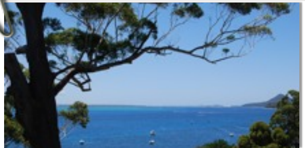
Nelson Bay (Küste 250 km entfernt von Sydney)